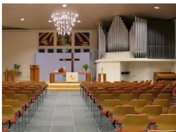
Goede Herder kerk Borger